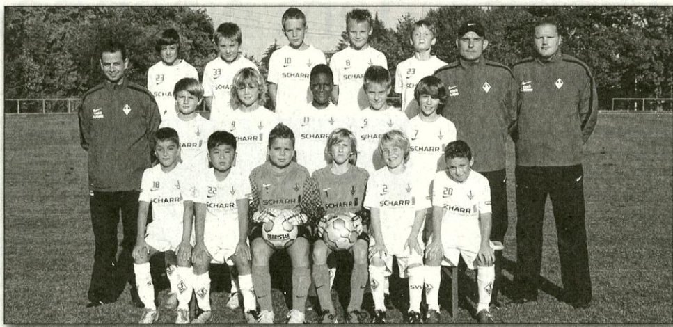
Die U11-Junioren des SV Vaihingen wollen beim internationalen Turnier um den Scharr-Cup im heimischen Schwarzbachstadion eine gute Rolle spielen.

Insgesamt dürfen die Vaihinger Spitzenvereine aus sechs Nationen begrüßen.